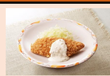
★3 ササミチーズカツ